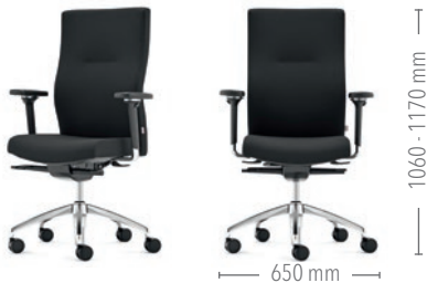
Mit hoher Rückenlehne