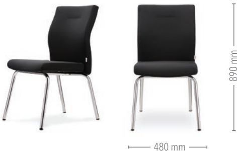
Vierbeinstuhl ohne Armlehnen