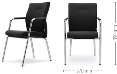
Vierbeinstuhl mit Armlehnen