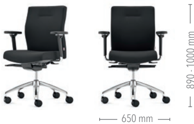
Mit mittelhoher Rückenlehne