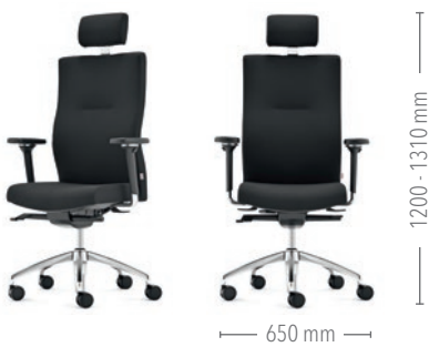
Mit hoher Rückenlehne und Kopfstütze