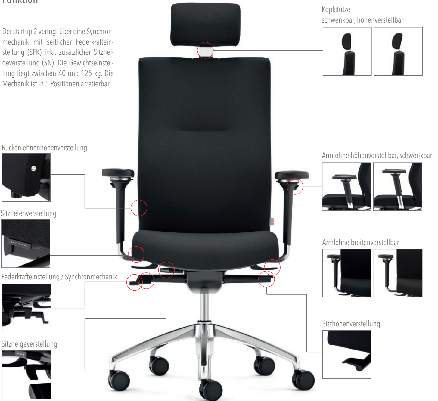
Kopfstütze schwenkbar, höhenverstellbar

Der startup 2 verfügt über eine Synchronmechanik mit seitlicher Federkrafteinstellung (SFK) inkl. zusätzlicher Sitzneigeverstellung (SN). Die Gewichtseinstellung liegt zwischen 40 und 125 kg. Die Mechanik ist in 5 Positionen arretierbar.