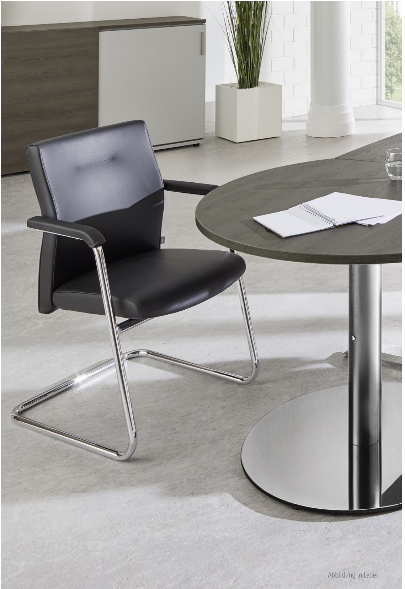
Abbildung in Leder