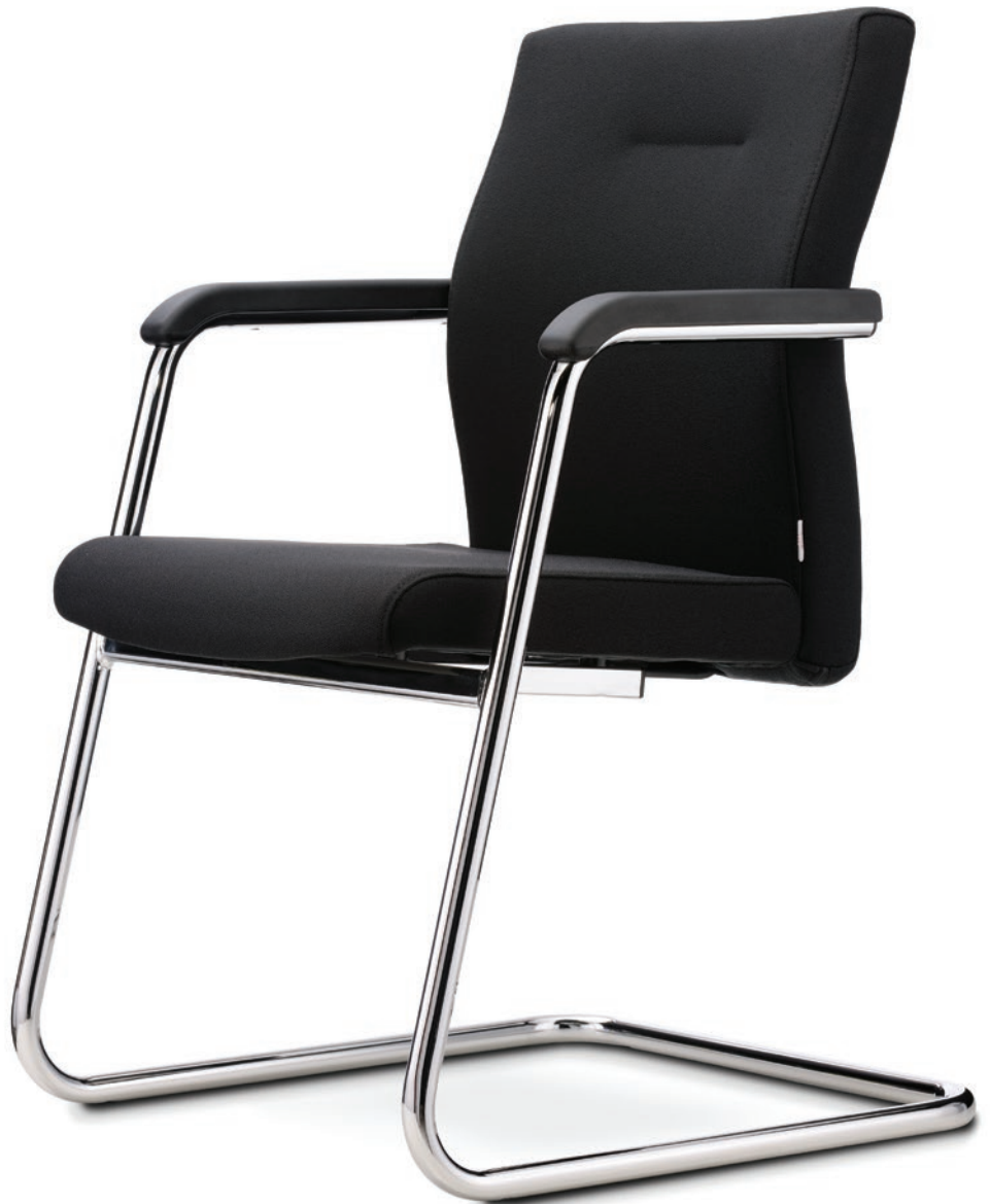
Abbildung mit PU-Armauflagen

Auch in stapelbarer Ausführung erhältlich.