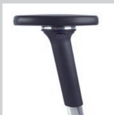
4D Multifunktionsarmlehne NPR