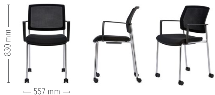
Vierfuß Konferenz mit Rollen