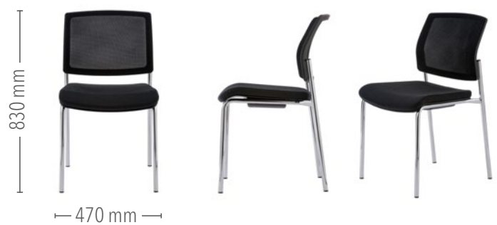
Vierfuß Konferenz ohne Armlehnen