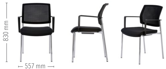
Vierfuß Konferenz, mit Armlehnen

Für den robusten Einsatz ist der Vierfuß Konferenz auch ohne Polster mit einer Kunststoff-Sitzschale erhältlich.