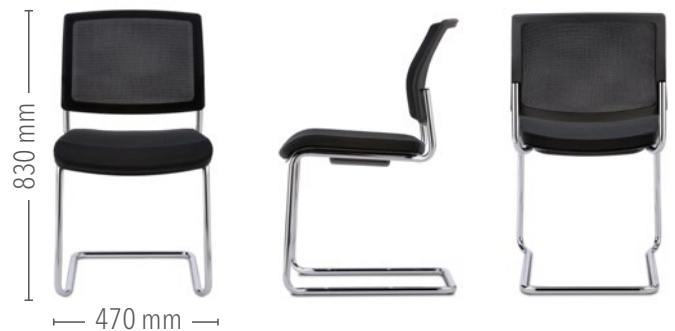
NetGo Konferenz Freischwinger ohne Armlehnen, Abb. stapelbar