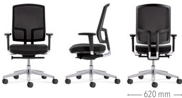
Mit Sitztiefenverstellung und Multifunktionsarmlehnen (3D) Gestell in Aluminium poliert