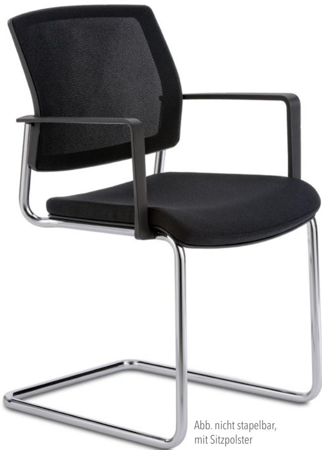
Abb. nicht stapelbar, mit Sitzpolster