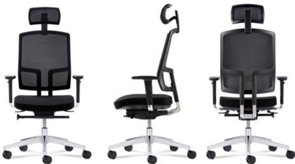
Wahlweise mit Kopfstütze erhältlich