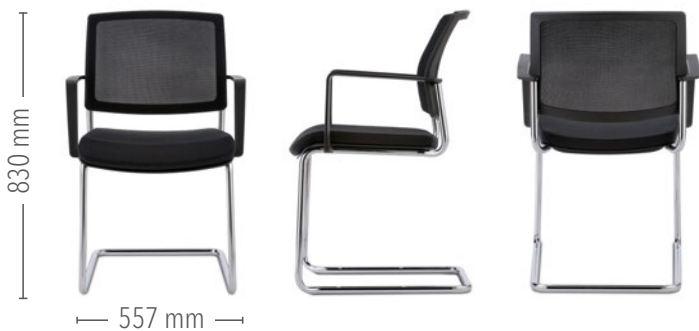
NetGo Konferenz Freischwinger mit Armlehnen, Abb. nicht stapelbar