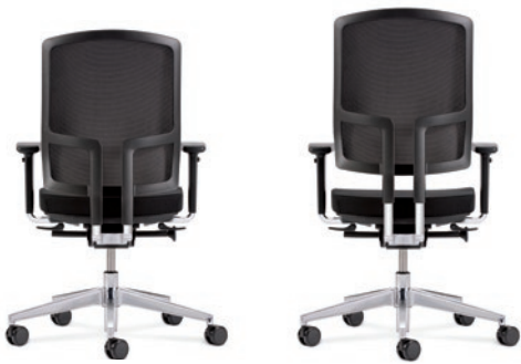
Der Verstellbereich des NetZRückens beträgt 70 mm. Rückenstab aus Aluminium poliert