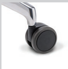
Rollen weich (für harte Böden)